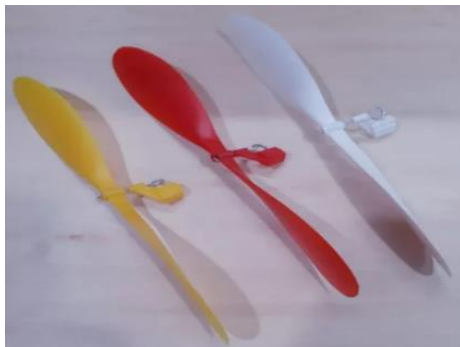
ลักษณะตัวอย่างของหัวสำเร็จรูป