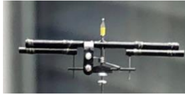
ลักษณะตัวอย่างของ VP.