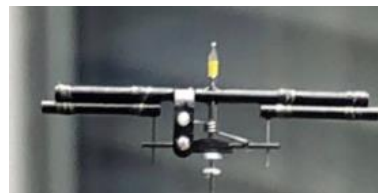
ลักษณะตัวอย่างของ VP.