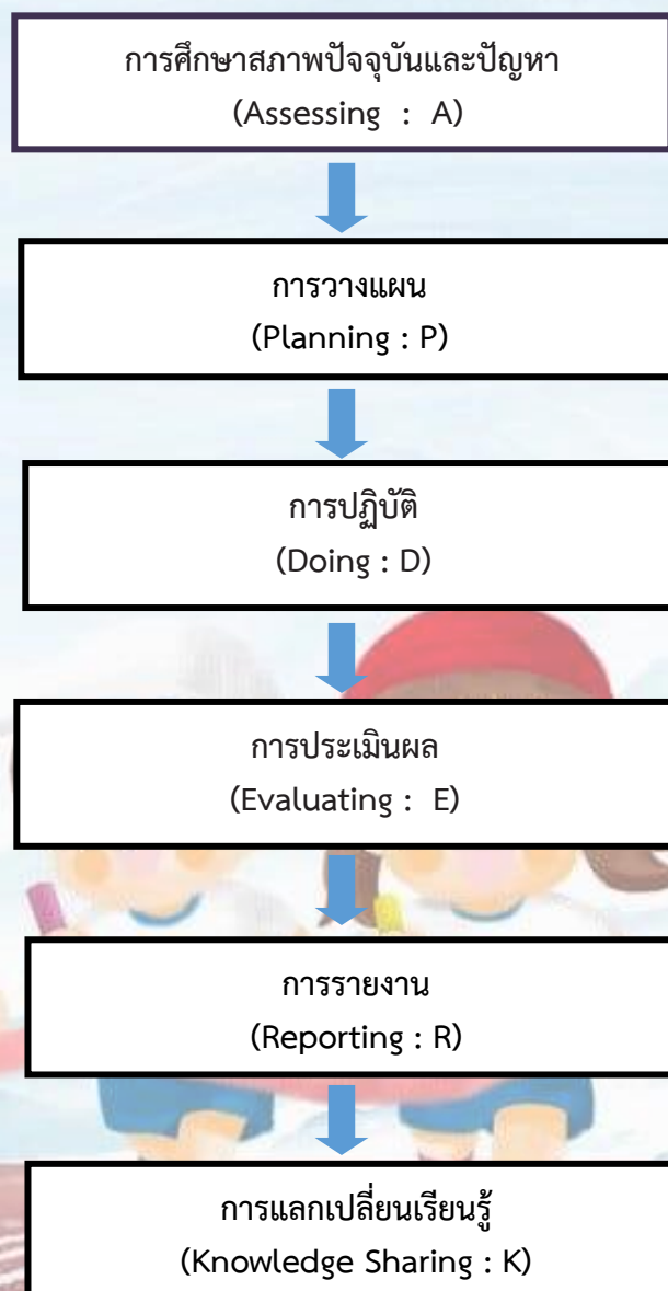
แผนภาพที่ 1 กระบวนการบริหารจัดการแบบมีส่วนร่วม Six Steps: APDERK ของสำนักงานเขตพื้นที่การศึกษาประถมศึกษา เชียงใหม่ เขต 4

สำนักงานเขตพื้นที่การศึกษาประถมศึกษา เชียงใหม่ เขต 4 ดำเนินการบริหารจัดการ แบบมีส่วนร่วม Six Steps ตามกระบวนการ 6 ขั้นตอน คือ 1) การศึกษาสภาพปัจจุบันและปัญหา (Assessing) 2) การวางแผน (Planning) 3) การปฏิบัติ (Doing) 4) การประเมินผล (Evaluating) 5) การรายงานผล (Reporting) และ 6) การแลกเปลี่ยนเรียนรู้ (Knowledge Sharing) ดังแผนภาพที่ 1 และแผนภาพที่ 2 ดังนี้