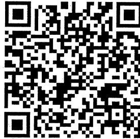
แบบกรอกข้อมูลสมัครฯ

แบบกรอกข้อมูลสมัครฯ สามารถดาวน์โหลดได้ตาม URL: bit.ly/3QVFzUP หรือสแกน QR Code ด้านล่างนี้